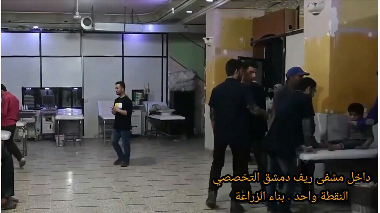
داخل مشفى ريف دمشق التخصصي النقطة واحد - بناء الزراعة

١٩- من داخل مشفى ريف دمشق التخصصي (النقطة واحد) التي تقع تحت بناء الزراعة قرب دوار الشهداء بمدينة دوما في الغوطة الشرقية.