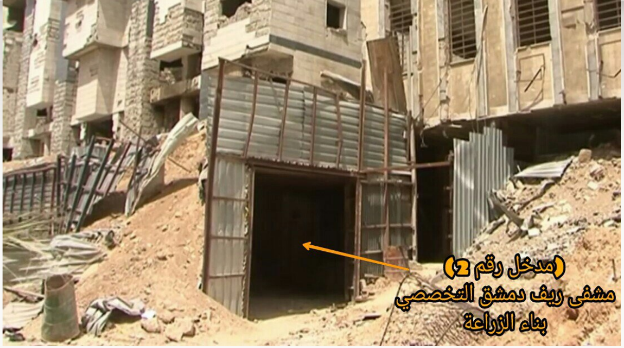
١٣- تظهر في الصورة مشفى ريف دمشق التخصصي (النقطة واحد) المحصنة بشكل كامل، والتي تقع تحت بناء الزراعة قرب دواء الشهداء بمدينة دوما في الغوطة الشرقية.