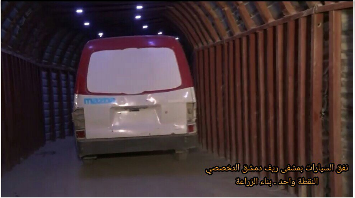
نفق السيارات بمشفي ريف دمشق التخصصي النقطة واحد - بناء الزراعة

١٧- نفق سيارات الإسعاف الذي يمتد من داخل مشفى ريف دمشق التخصصي (النقطة واحد) إلى أنفاق أخرى بمدينة دوما في الغوطة الشرقية.