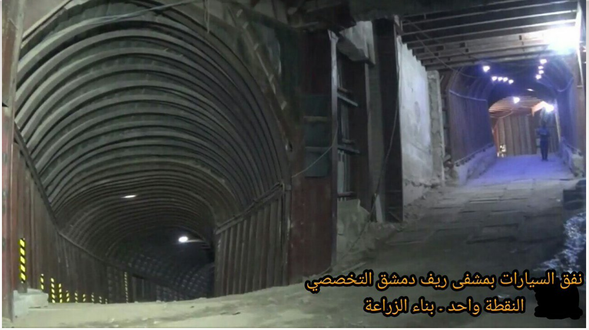
نفق السيارات بمشفى ريف دمشق التخصصي النقطة واحد - بناء الزراعة

١٩- من داخل مشفى ريف دمشق التخصصي (النقطة واحد) التي تقع تحت بناء الزراعة قرب دوار الشهداء بمدينة دوما في الغوطة الشرقية.